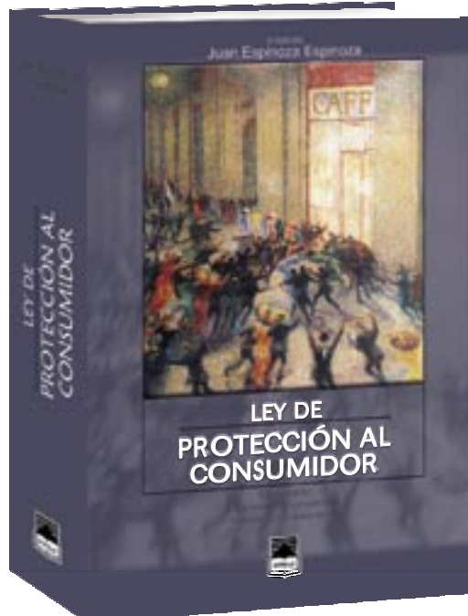
Ley de Protección al Consumidor